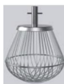
Frusta fili fini Fine wire whisk