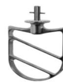
Spatola in alluminio Aluminium beater