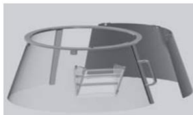
Protezione fissa/girevole in plastica "F" Fixed rotating plastic safety guard "F"